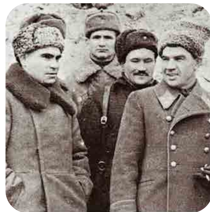
Хроника истинного героизма

14 октября 1901 года, село Гурово, Козельский уезд, Калужская губерния, Российская империя