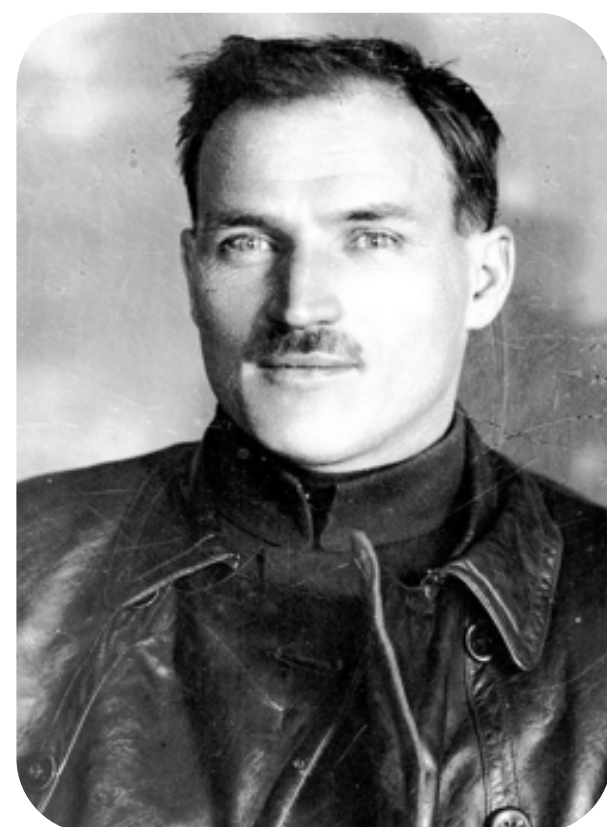
Фёдор Андреевич Сергеев «Товарищ Артем»

Родился 7 марта 1883 года в селе Глебово Фатежского уезда Курской губернии.