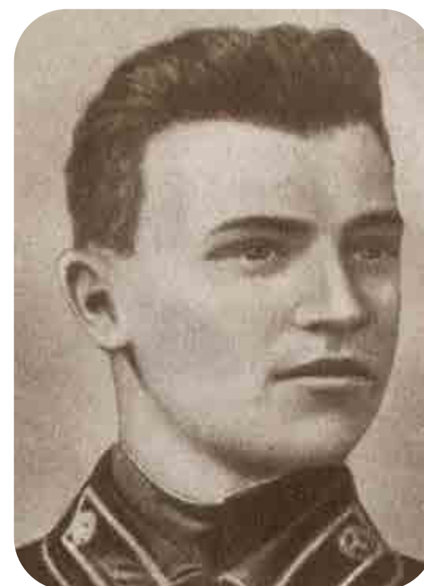
Благодарная память потомков

Создал и возглавил Донецко-Криворожскую советскую республику, которая стала подтверждением извечного стремления Донбасса быть с Россией, примером борьбы Донбасса за советскую власть и экономическое единство.