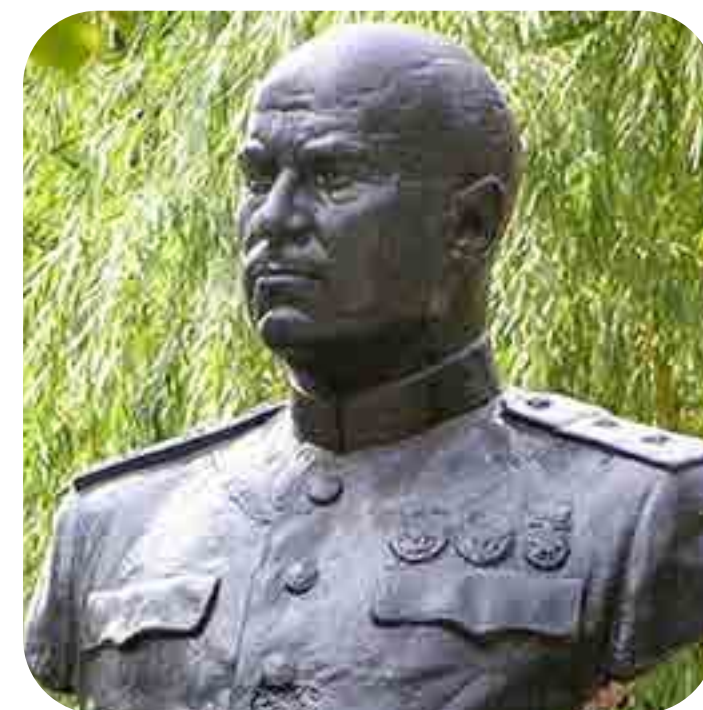
Благодарная память потомков

Главный подвиг генерала заключался в том, что он сумел в критический момент сражения за Донбасс в 1943 году поднять моральный дух войск перед штурмом «Миус-фронта».