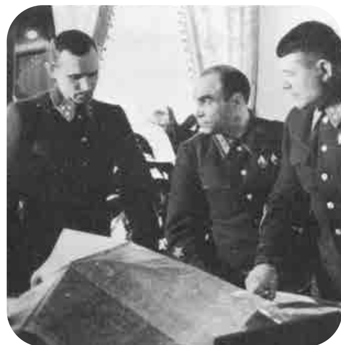
Кузьма Акимович Гуров