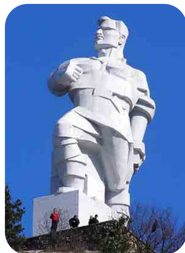
Роль в судьбе региона и страны

Родился 7 марта 1883 года в селе Глебово Фатежского уезда Курской губернии.